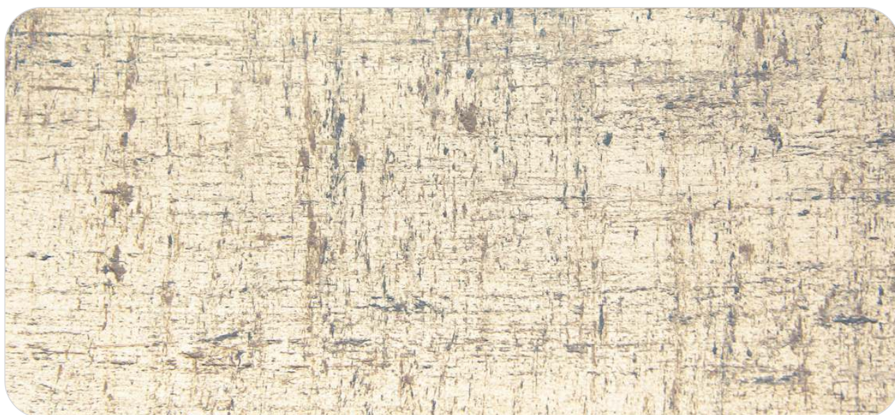
Ref. CK 7