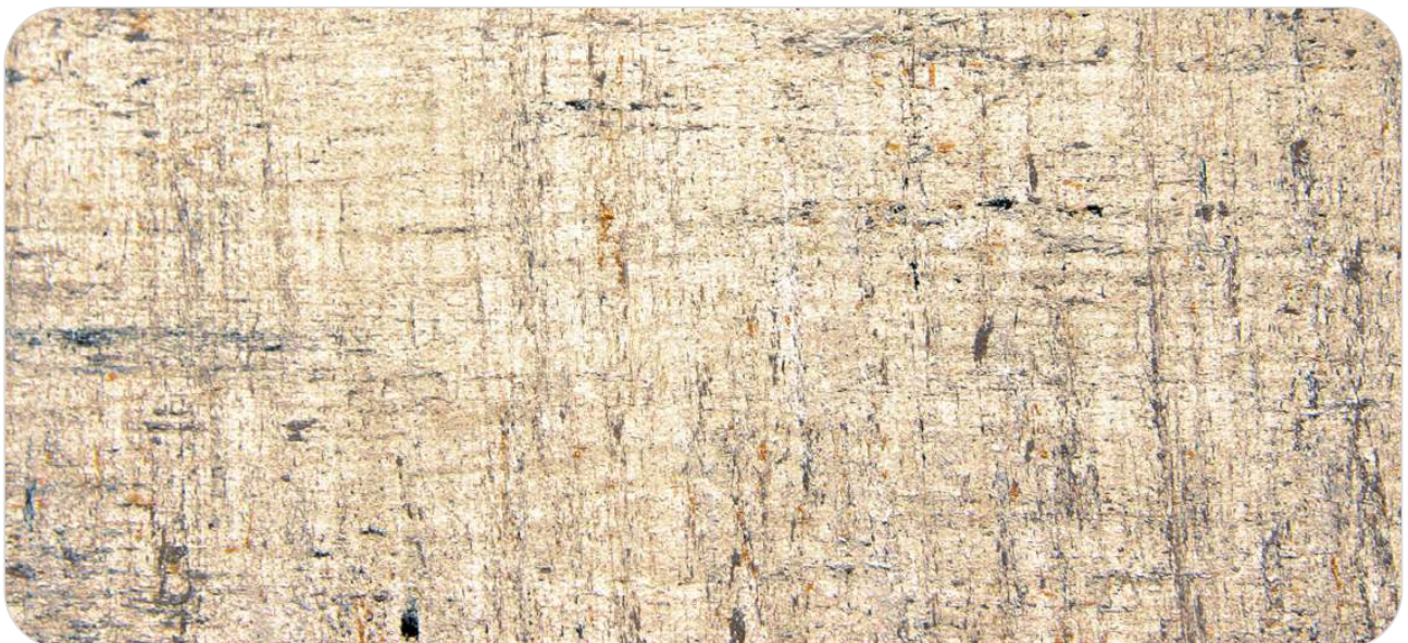
Ref. CK 4

W zależności od partii produktu i sposobu jego nakładania możliwe są różnice w efekcie końcowym.