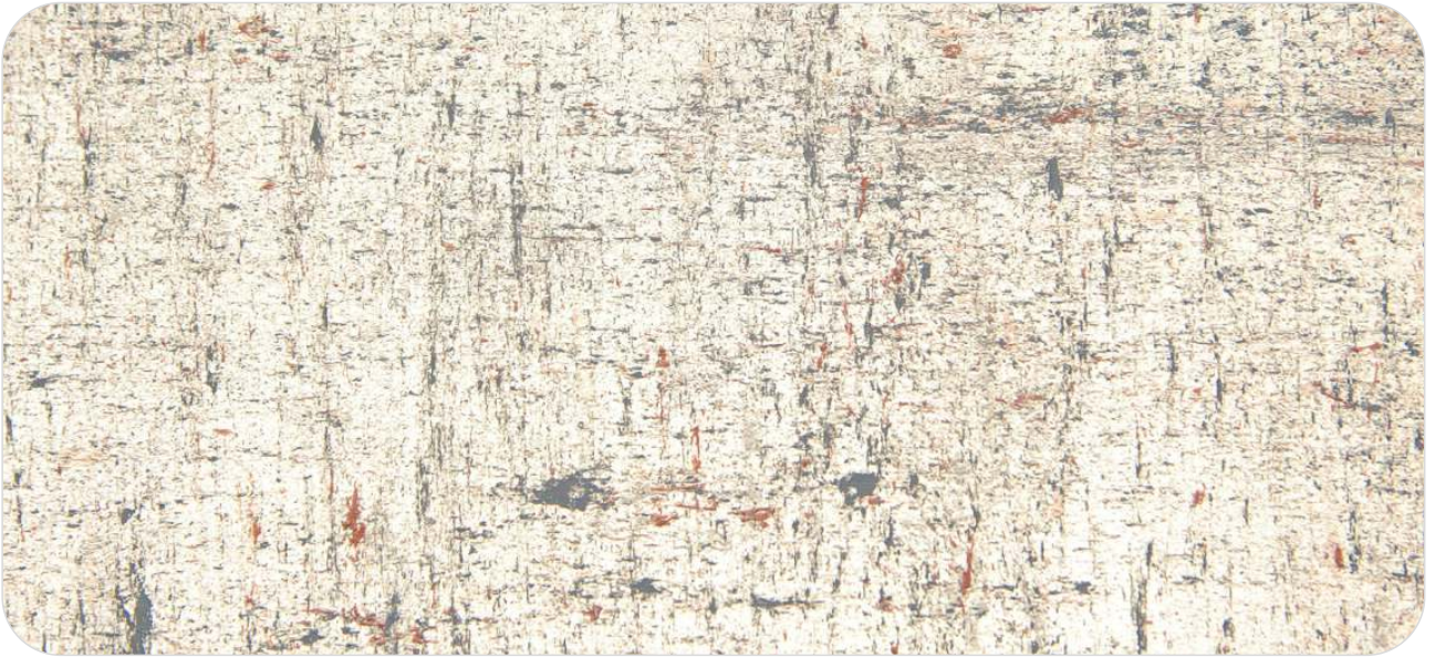
Ref. CK 1