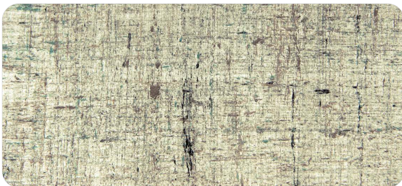
Ref. CK 5