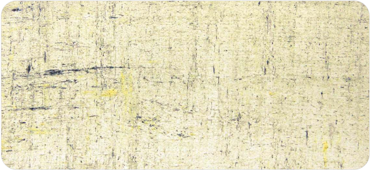
Ref. CK 3