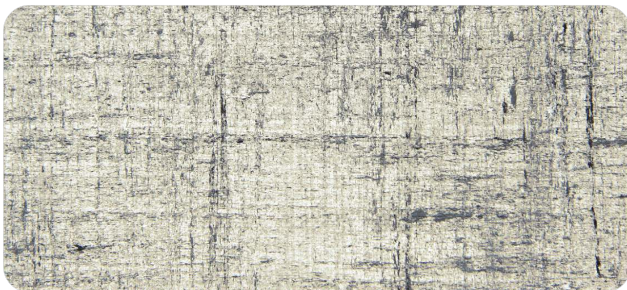
Ref. CK 6