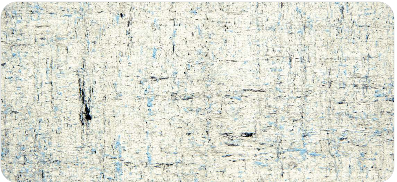
Ref. CK 2