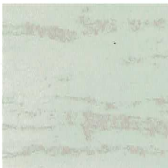
Ref. VT 3020