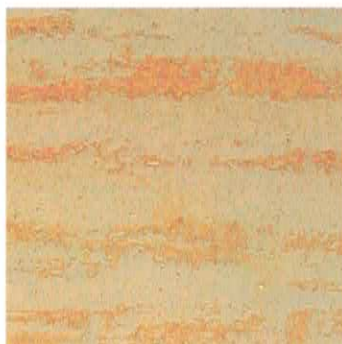
Ref. VT 3025