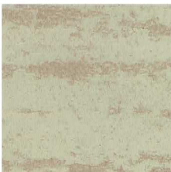
Ref. VT 3026