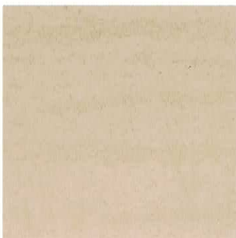
Ref. VT 3024