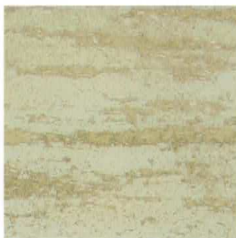
Ref. VT 3027