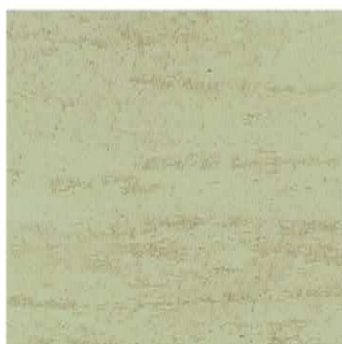
Ref. VT 3023