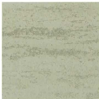
Ref. VT 3021